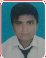
संगम पहरी (GPA – 2.95),

श्री सरस्वती निकेतन मा.वि., काठमाडौं (सहयोगी सदस्य - कोर्नेलिया रिचर्डर)