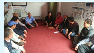
ललितपुर अध्ययन केन्द्र

बिभिन्न प्रकारका प्रकोप खास गरी विपद्सँग सम्बन्धित सामग्रीहरू यस केन्द्रमा राखिएका छन् । समुदायका सबै मानिसहरू यी केन्द्रमा गई आफ्ना मनमा लागेका र आवश्यक कुराहरू केन्द्रमा रहनु भएका स्वयम् सेवकहरूसँग सोध्न र जानकारी प्राप्त गर्न सक्नेछन् ।