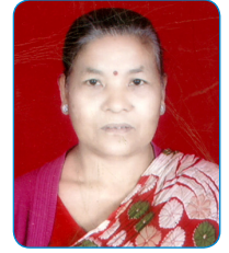
सुन केशरी श्रेष्ठ