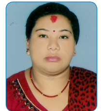
पूर्ण लक्ष्मी श्रेष्ठ