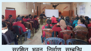
सुरक्षित भवन निर्माण सम्बन्धि अभिमुखिकरण कार्यक्रम