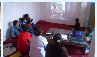
काठमाडौं अध्ययन केन्द्र