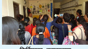
किर्तिपुरका वडाहरूमा एक्सपोजर भिजिट