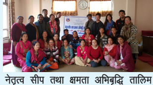
नेतृत्व सीप तथा क्षमता अभिवृद्धि तालिम