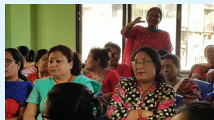
गोरखा भूकम्पको अनुभव समेट्न अन्तरक्रिया कार्यक्रम