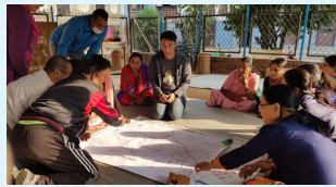
विपद् जोखिम न्युनिकरण नक्सा तयार गर्दै